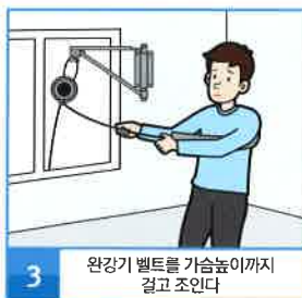
3 완강기 벨트를 가슴높이까지 걸고 조인다