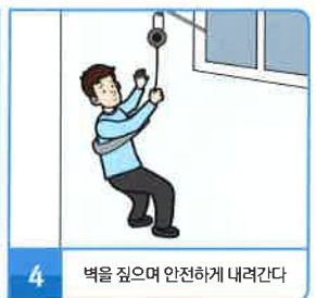
4 벽을 짚으며 안전하게 내려간다