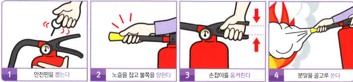
1 안전핀을 뽑는다