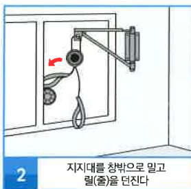
2 지지대를 창 밖으로 밀고 림(줄)을 던진다