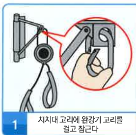
1 지지대 고리에 완강기 고리를 걸고 잠근다