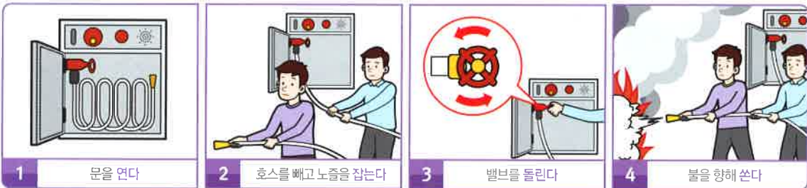
1 문을 연다